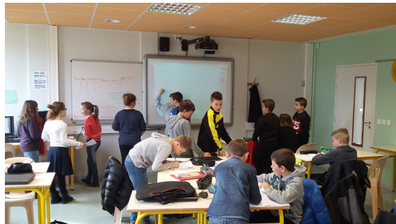
Photos des classes au travail