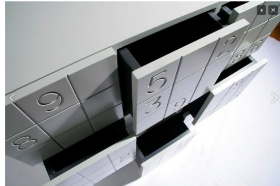
IMG_2180 - tiroirs coulissants typto blanc - www.sifferlin.com Item 14 of 19

En allant sur le site du créateur http://www.sifferlin.com/page/16/